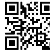
Burhanuddin, M.Kom NRP. 17 13 14